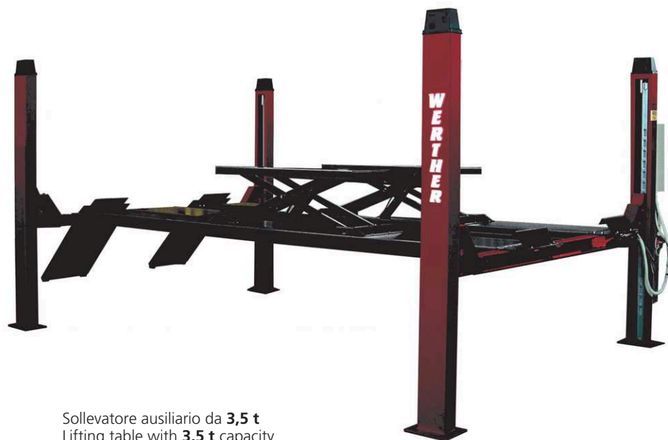
Sollevatore ausiliario da 3,5 t Lifting table with 3,5 t capacity Levage auxiliaire capacité 3,5 t Radfreiheber 3,5 t Tragkraft

Sollevatore elettroidraulico a 4 colonne con incavi anteriori e piastre oscillanti posteriori per allineamento ruote e sollevatore ausiliario incorporato