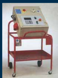
Unità di comando carrellata Control unit on separate mobile desk Pupitre de commande sur console mobile Schaltaggregat auf mobilem Steuerpult